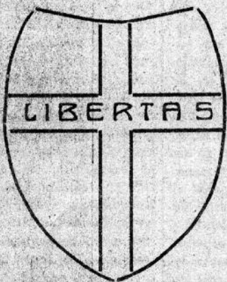
La presentazione dello stemma del Partito popolare italiano pubblicata su "IL POPOLO" di Viterbo in data 26 ottobre 1919

Esso sarà «lo scudo crociato» ricordo e simbolo dei gloriosi Comuni d'Italia e recherà scritta nel centro la parola Libertas aspirazione alta e pura di tutte le coscienze cristiane. La libertà dunque ampia, senza confini, senza alti limiti che quelli che rampollano dalla viva coscienza cristiana, che segnano la disciplina di ogni uomo che nell'ossequio alla legge suprema di Dio sono sua vera liberazione.