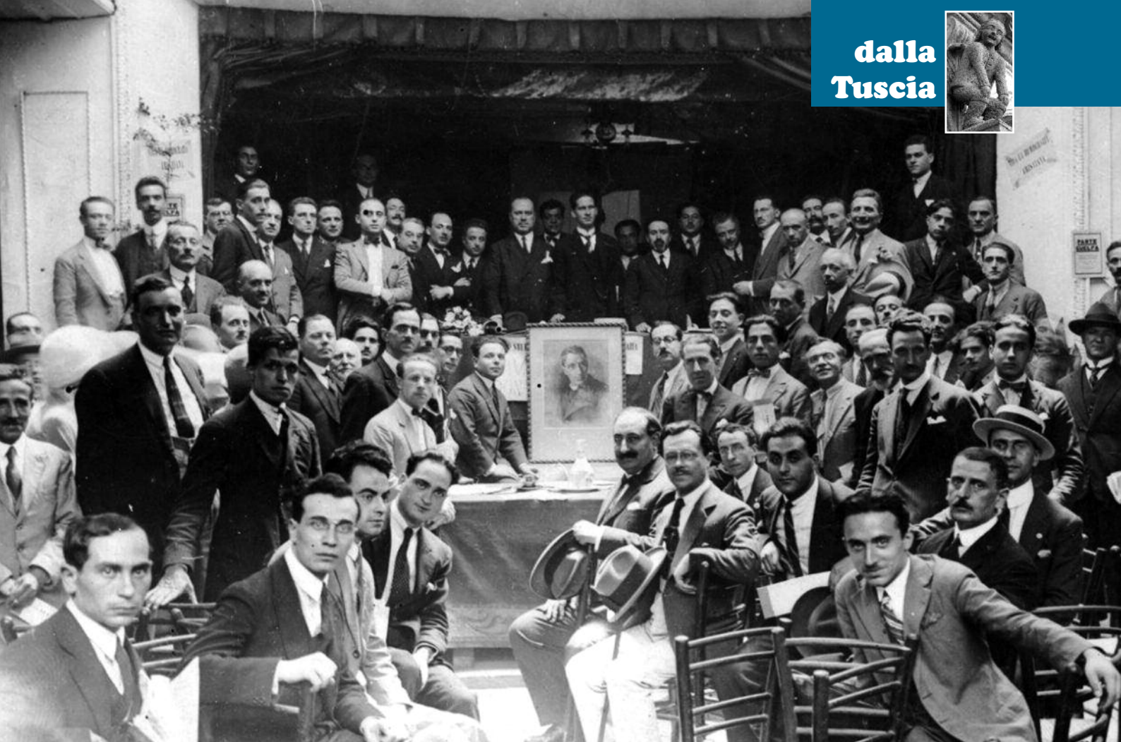
Roma 1925: i delegati dell'ultimo congresso del Partito Popolare riuniti attorno al ritratto di don Luigi Sturzo che all'epoca si trovava in esilio a Londra

diocesani e parrocchiali. Il suo sviluppo fu tale che nel 1897 essa contava 3982 comitati parrocchiali, 708 sezioni giovanili, 12 circoli universitari, 700 casse rurali, circa 700 società operaie, 24 banche cattoliche e una società di assicurazione. Faceva capo all'Opera anche la stampa cattolica nazionale. L'enciclica "Rerum Novarum" di Leone XIII, del 15 maggio 1891, aveva dato all'Opera dei Congressi una forte spinta di azione sociale. Tuttavia, la successiva enciclica "Graves de communi", dell'8 gennaio 1901, fu causa di contrasti, soprattutto da parte dei gruppi che sollecitavano la partecipazione dei cattolici alle battaglie politiche. Il pontefice, infatti, aveva riconfermato gli indirizzi sociali dell'Opera dei Congressi, ma non riteneva opportuno che i cattolici operassero in campo politico. Nacquero così nell'associazione forti contrasti fra i tradizionalisti, legati esclusivamente all'attività sociale, e il gruppo giovanile capeggiato da don Romolo Murri che sollecitava un impegno più deciso nella lotta politica e una partecipazione attiva dei cattolici nella vita dello Stato.