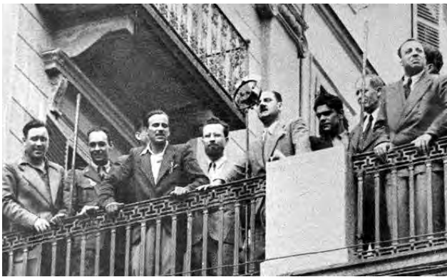
Dal balcone della propria casa Duccio Galimberti sollecita la cittadinanza a combattere per la resistenza

valorose divisioni partigiane. Alla testa di queste divisioni cadeva una volta ferito ma non abbandonava il posto di combattimento e di comando prima di aver assicurato le sorti dei suoi reparti. Non ancora guarito assumeva il comando di formazioni partigiane piemontesi, prodigandosi incurante di ogni rischio.