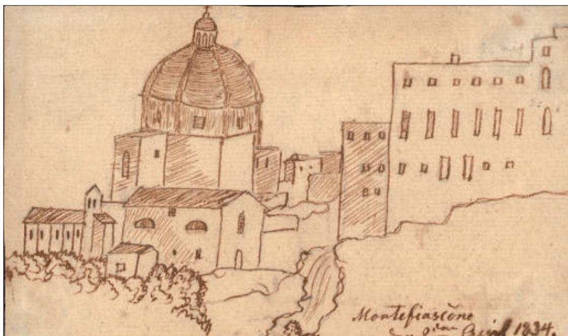
Montefiascone den 2den April 1834, disegno di Hans Christian Andersen, Odense Bys Museer