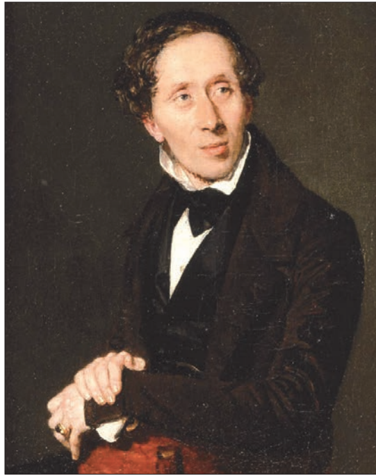
Hans Christian Andersen in un ritratto giovanile

Consumammo un pasto in una miserabile osteria dove la padrona ci offrì dell'acqua calda con formaggio e sale che lei chiamava zuppa, ma quando poi pretese dieci volte il prezzo di una zuppa decente, io l'insultai.